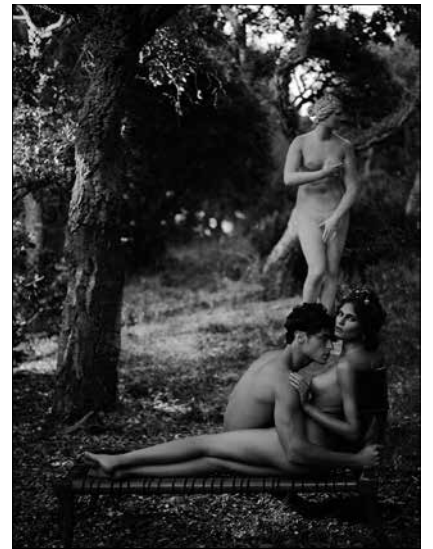
Karl Lagerfeld Daphnis et Chloé 2013 • Impression acrylique sur toile © 2015 Karl Lagerfeld