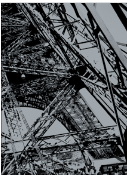
Karl Lagerfeld Designed by Man and Nature 2010 • Sérigraphie © 2015 Karl Lagerfeld