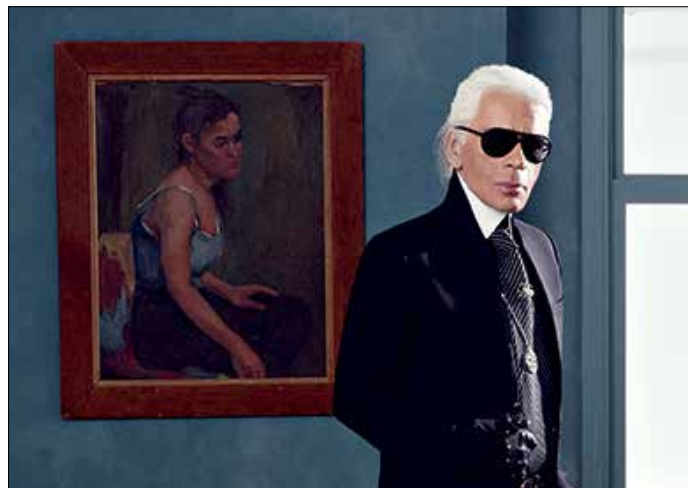
Karl Lagerfeld Autoportrait, New York (détail) 2011 • Impression jet d'encre couleur sur papier Fabriano 50 x 70 cm © 2015 Karl Lagerfeld

« Ce qui m'amuse, c'est ce que je n'ai jamais fait », affirme Karl Lagerfeld. Ne pouvant se satisfaire