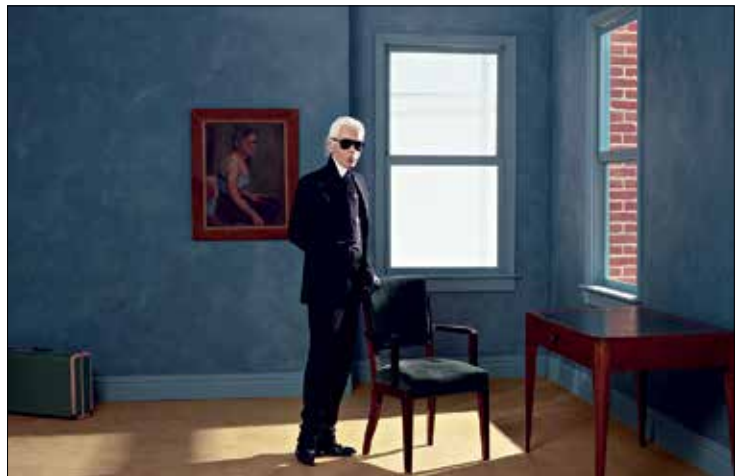
Karl Lagerfeld Autoportrait, New York 2011 • Impression jet d'encre couleur sur papier Fabriano 50 x 70 cm © 2015 Karl Lagerfeld