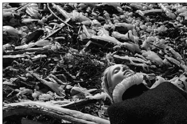
Karl Lagerfeld Heidi Mount, Vermont 2009 • Impression jet d'encre noir et blanc sur papier Arches 50 x 70 cm © 2015 Karl Lagerfeld