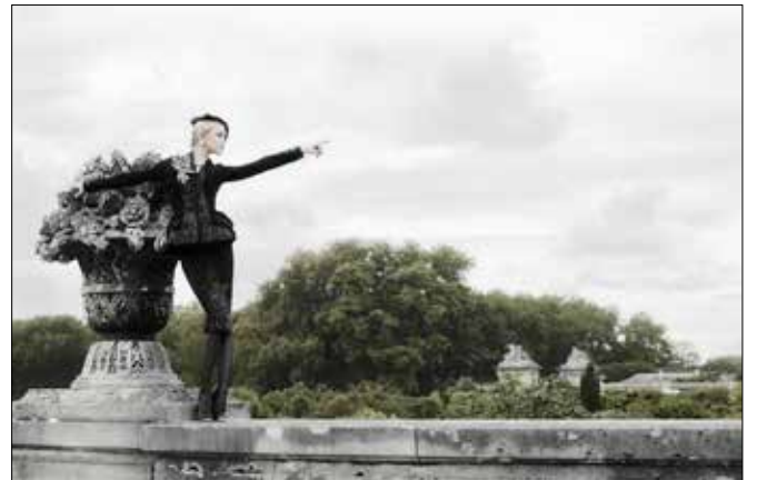
Karl Lagerfeld Jessica Stam, Harper's Bazaar, États-Unis 2007 • Impression acrylique sur aluminium © 2015 Karl Lagerfeld