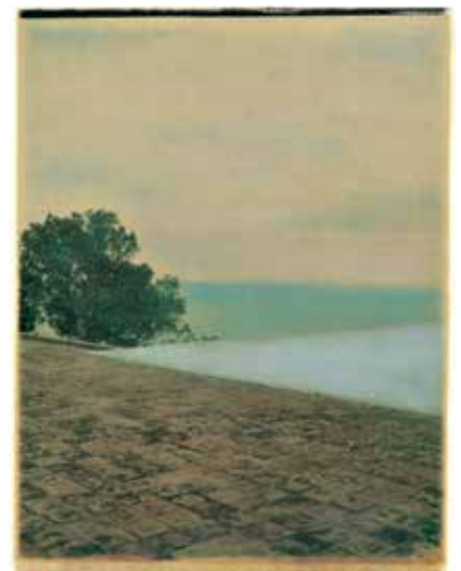
Karl Lagerfeld Villa Malaparte 1998 • Sérigraphie © 2015 Karl Lagerfeld