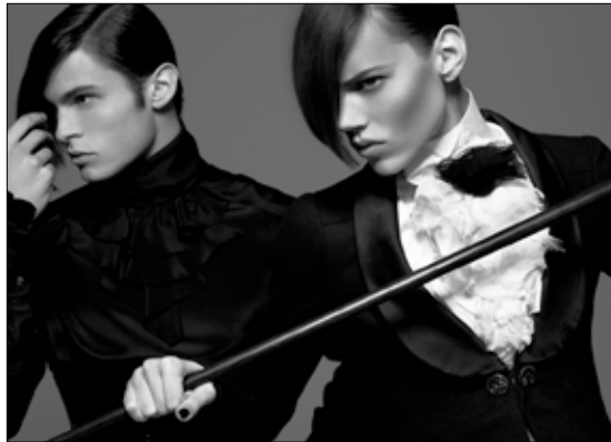
Karl Lagerfeld Monokel Diele, Vogue, Allemagne 2009 • Impression acrylique sur aluminium © 2015 Karl Lagerfeld