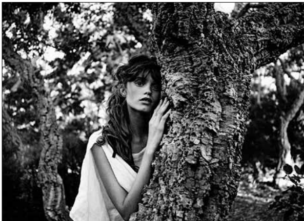
Karl Lagerfeld Daphnis et Chloé 2013 • Impression acrylique sur toile © 2015 Karl Lagerfeld