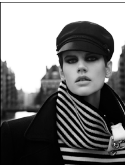
Karl Lagerfeld Saskia de Brauw, Vogue, Allemagne 2013 • Impression acrylique sur aluminium © 2015 Karl Lagerfeld