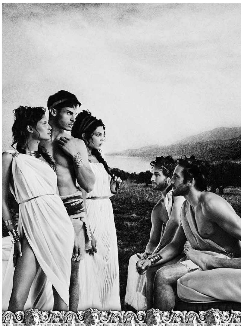
Karl Lagerfeld Le Voyage d'Ulysse 2013 - Impression acrylique sur toile © 2015 Karl Lagerfeld