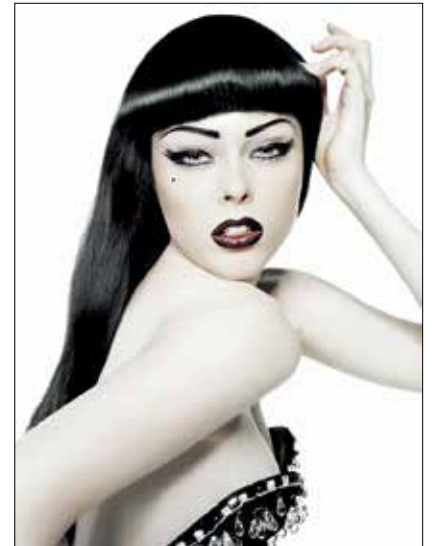
Karl Lagerfeld Coco Rocha, Numéro 2007 • Impression acrylique sur aluminium © 2015 Karl Lagerfeld