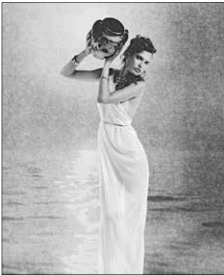
Karl Lagerfeld Le Voyage d'Ulysse 2013 • Impression acrylique sur toile © 2015 Karl Lagerfeld