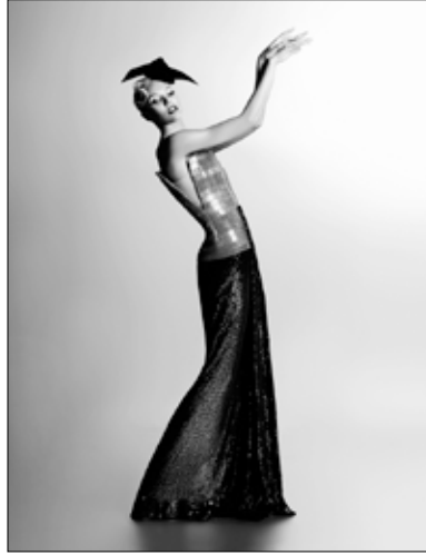
Karl Lagerfeld Candice Swanepoel, Harper's Bazaar, Corée 2011 • Impression acrylique sur aluminium © 2015 Karl Lagerfeld