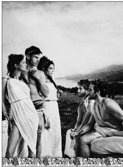
Karl Lagerfeld Le Voyage d'Ulysse 2013 • Impression acrylique sur toile © 2015 Karl Lagerfeld