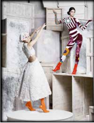
Karl Lagerfeld Kendall Jenner, Harper's Bazaar, États-Unis 2015 • Impression acrylique sur aluminium © 2015 Karl Lagerfeld