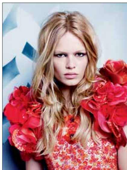
Karl Lagerfeld Anna Ewers, Numéro 2015 • Impression acrylique sur aluminium © 2015 Karl Lagerfeld