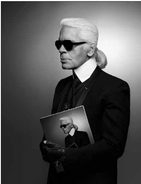
Karl Lagerfeld Autoportrait 2013 • Impression jet d'encre noir et blanc sur papier Fabriano • 50 x 70 cm © 2015 Karl Lagerfeld

Les visuels disponibles pour la presse en haute-définition sont disponibles au téléchargement sur le site Internet de la Pinacothèque de Paris ( www.pinacothèque.com , onglet « Presse »). Pour plus d'informations, merci de contacter l'agence de presse Kalima : tsaustier@kalima-rp.fr .