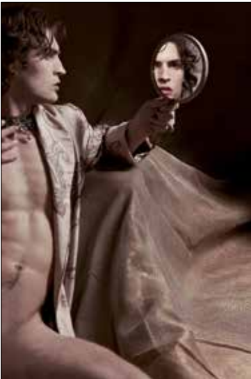
Karl Lagerfeld Un portrait de Dorian Gray 2005 • Impression acrylique sur toile © 2015 Karl Lagerfeld