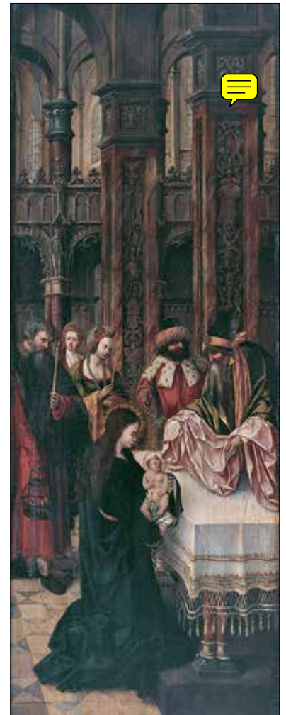
Peintre anonyme hispano-flamand La Résurrection (détail) Triptyque • Non datée Huile sur bois • 86 x 27 cm Collection Gerstenmaier