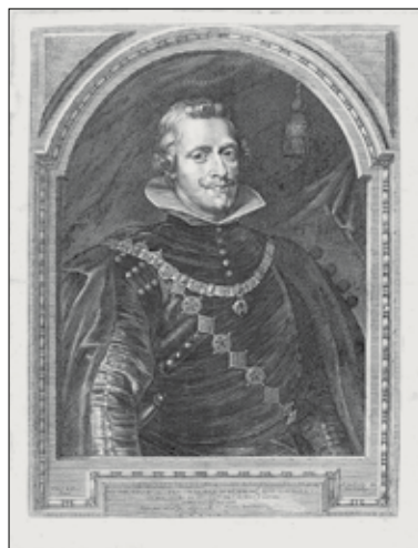
Pierre-Paul Rubens (Siegen, 1577-Anvers, 1640) Portrait de Philippe IV d'Espagne 1632 • Gravure à l'eau-forte estampée sur papier vergé • 48,5 x 38 cm Collection Gerstenmaier