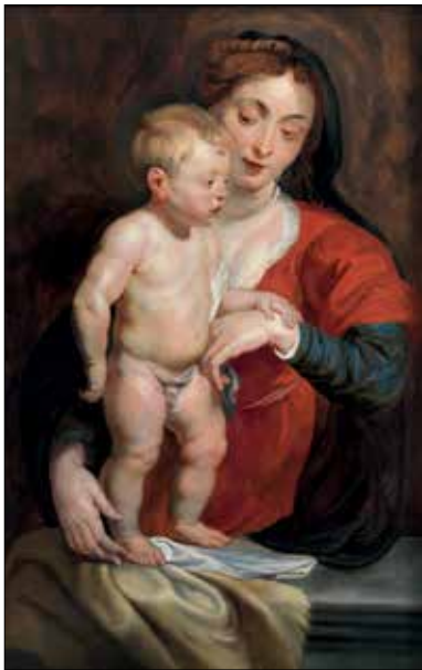
Pierre-Paul Rubens (Siegen, 1577-Anvers, 1640) La Vierge dite de Cumberland Non datée • Huile sur bois • 105 x 68 cm Collection Gerstenmaier

Les visuels pour la presse en HD sont disponibles au téléchargement sur le site de la Pinacothèque de Paris ( www.pinacothèque.com , onglet « Presse »). Pour plus d'informations, merci de contacter l'agence de presse Kalima : tsaustier@kalima-rp.fr .