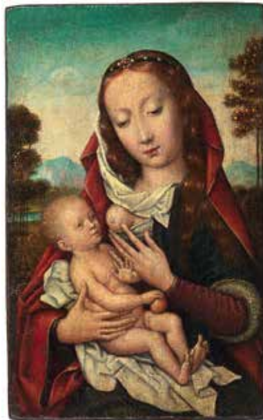
Peintre anonyme de l'École flamande Actif au XVI e siècle Vierge allaitant l'Enfant Jésus Non datée • Huile sur bois • 16 x 10 cm Collection Gerstenmaier