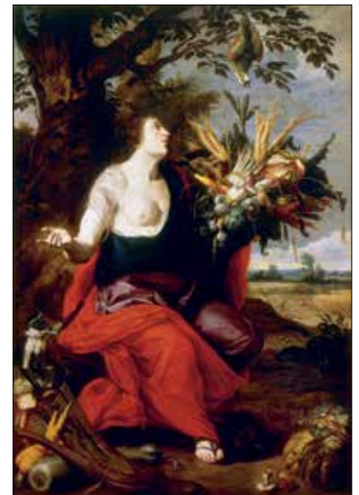
Juan Van Der Hamen y León (Madrid, 1596-1631) Allégorie de l'Été ou Cérès Non datée • Huile sur toile 217 x 151 cm Collection Gerstenmaier