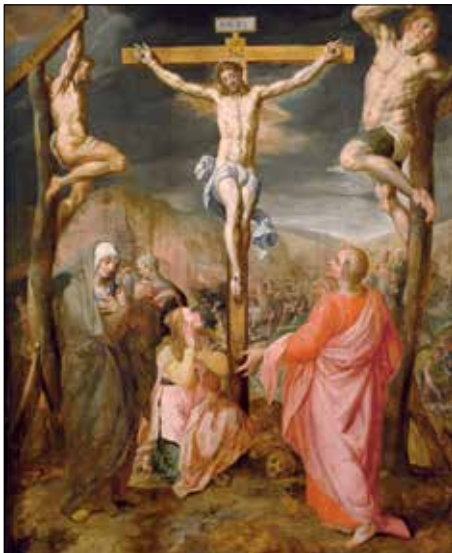
Adriaen Thomasz. Key (Anvers, c. 1560-c. 1591) Le Calvaire Non datée • Huile sur bois • 126 x 100 cm Collection Gerstenmaier