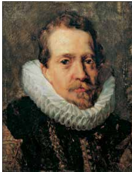
Anthony Van Dyck (Anvers, 1589-Blackfriars, 1641) Portrait de Jean-Charles de Cordes Non datée • Huile sur toile • 21 x 15,5 cm Collection Gerstenmaier