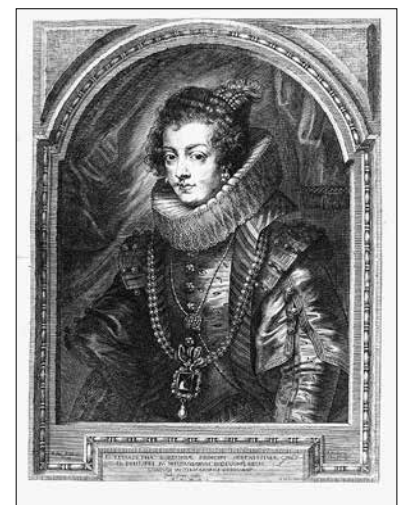
Pierre-Paul Rubens (Siegen, 1577-Anvers, 1640) Portrait d'Isabelle de Bourbon 1632 • Gravure à l'eau-forte estampée sur papier vergé • 48,5 x 38 cm Collection Gerstenmaier